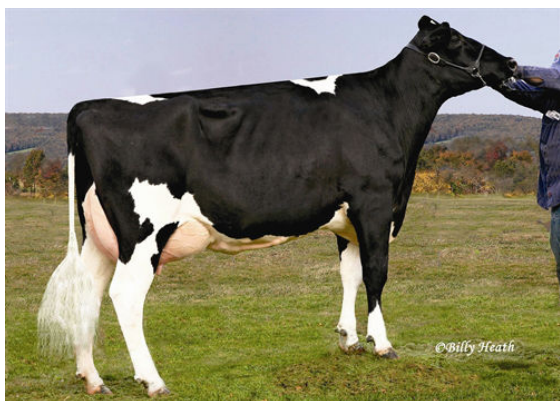
COOKIECUTTER GLD HOLLER FOURTH DAM